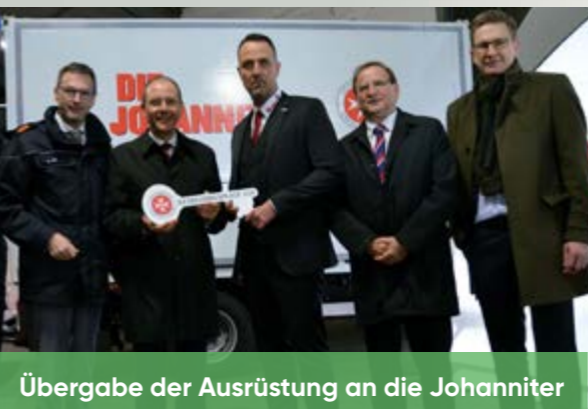
Übergabe der Ausrüstung an die Johanniter