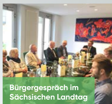
Bürgergespräch im Sächsischen Landtag

Naturkatastrophen oder Großbrände machen es häufig erforderlich, auch unverletzte evakuierte Personen betreuen zu können. Dafür wurde der Stützpunkt für Katastrophenschutz der Johanniter Unfallhilfe in Heidenau mit einem sogenannten "Betreuungsplatz 200" ausgerüstet. Bis zu 200 Personen können mit der angeschafften Ausrüstung betreut werden. Heidenau ist damit bundesweit einer von neun Standorten mit Ausrüstung dieser Art. Mein Dank gilt den Kameraden für die geleistete Arbeit!