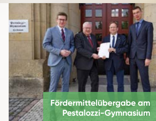
Fördermittelübergabe am Pestalozzi-Gymnasium

Mehr als 600.000 € Fördermittel aus dem Programm „Brücken in die Zukunft II“ fließen ganz aktuell allein in das Pestalozzi-Gymnasium . Unter Beachtung des Denkmalschutzes wird die Fassade des über 100 Jahre alten Gebäudes saniert. Das Bauprojekt bildet den Beginn für eine Reihe weiterer Baumaßnahmen, unter anderem die Neugestaltung des Schulhofes. Beste Bildung für unsere Kinder!