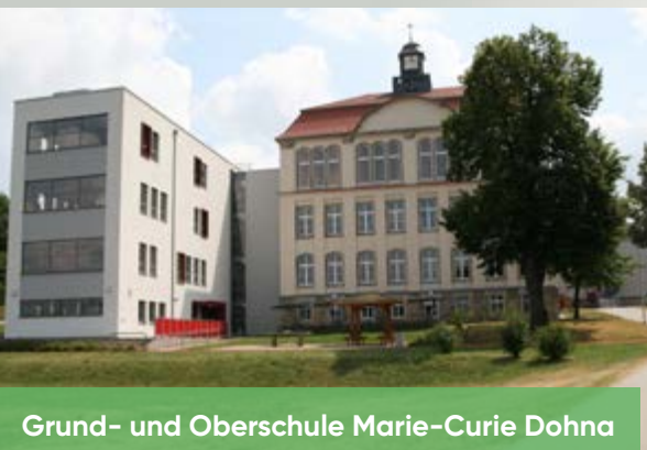
Grund- und Oberschule Marie-Curie Dohna