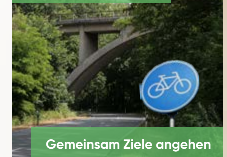
Gemeinsam Ziele angehen