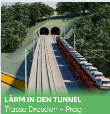
LÄRM IN DEN TUNNEL Trasse Dresden – Prag