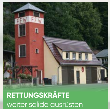
RETTUNGSKRÄFTE weiter solide ausrüsten