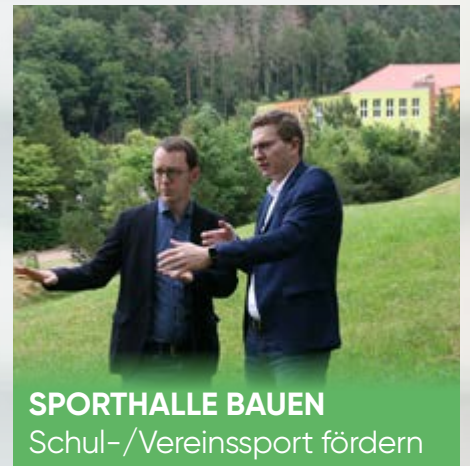
SPORTHALLE BAUEN Schul-/Vereinsport fördern