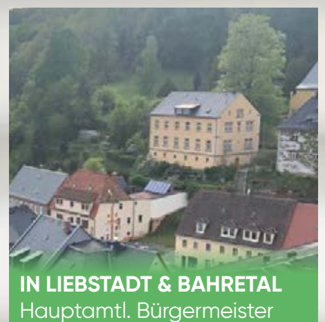
IN LIEBSTADT & BAHRETAL Hauptamtl. Bürgermeister