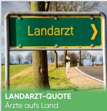
LANDARZT-QUOTE Ärzte aufs Land