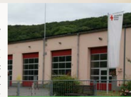
Wache erfolgreich ausgebaut

Mit einer modernen Rettungswache in Bad Gottleuba wurde die medizinische Versorgung deutlich optimiert. Medizinische Hilfe wird damit auch in den Orten Oelsen, Markersbach, Hellendorf, Hartmannsbach, Breitenau, Börnersdorf, Walddörfchen, Hennersbach, Zwiesel, Bahra, Langenhennersdorf, Berggießhübel und den angrenzenden Ortsteilen der Gemeinden Bahretal und Liebstadt optimal gewährleistet. Mit dem Neubau setzen wir ein deutliches Zeichen für die Bevölkerung des ländlichen Raumes. Weiterhin bringt die Zusammenarbeit mit der Feuerwehr einen zusätzlichen Nutzen für die Nachwuchsgewinnung und fördert damit die Vermittlung von Werten und den Dienst an der Gesellschaft.