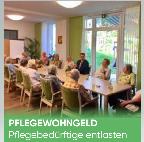
PFLEGEWOHNGELD Pflegebedürftige entlasten