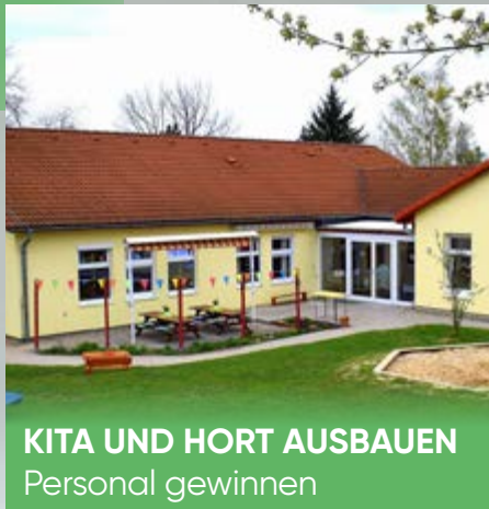
KITA UND HORT AUSBAUEN Personal gewinnen