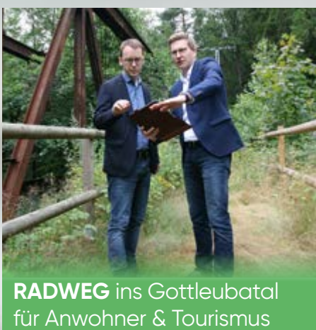
RADWEG ins Gottliebatal für Anwohner & Tourismus