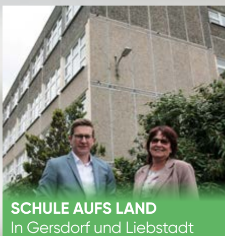
SCHULE AUFS LAND In Gersdorf und Liebstadt