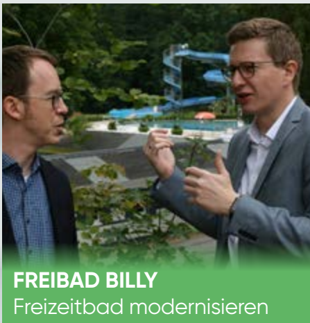
FREIBAD BILLY Freizeitbad modernisieren